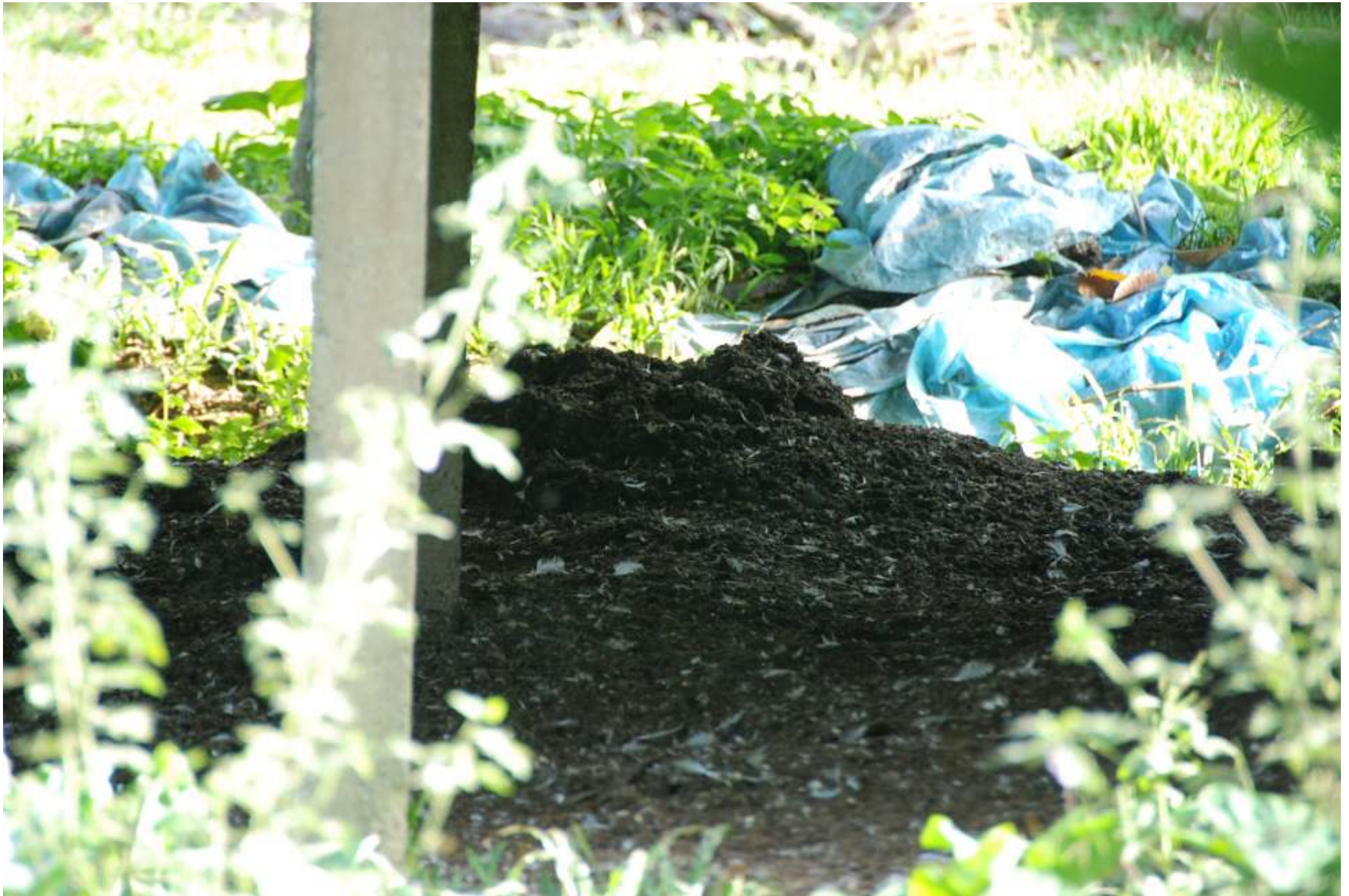
Longgokan najis ayam yang boleh menyebabkan penyakit.