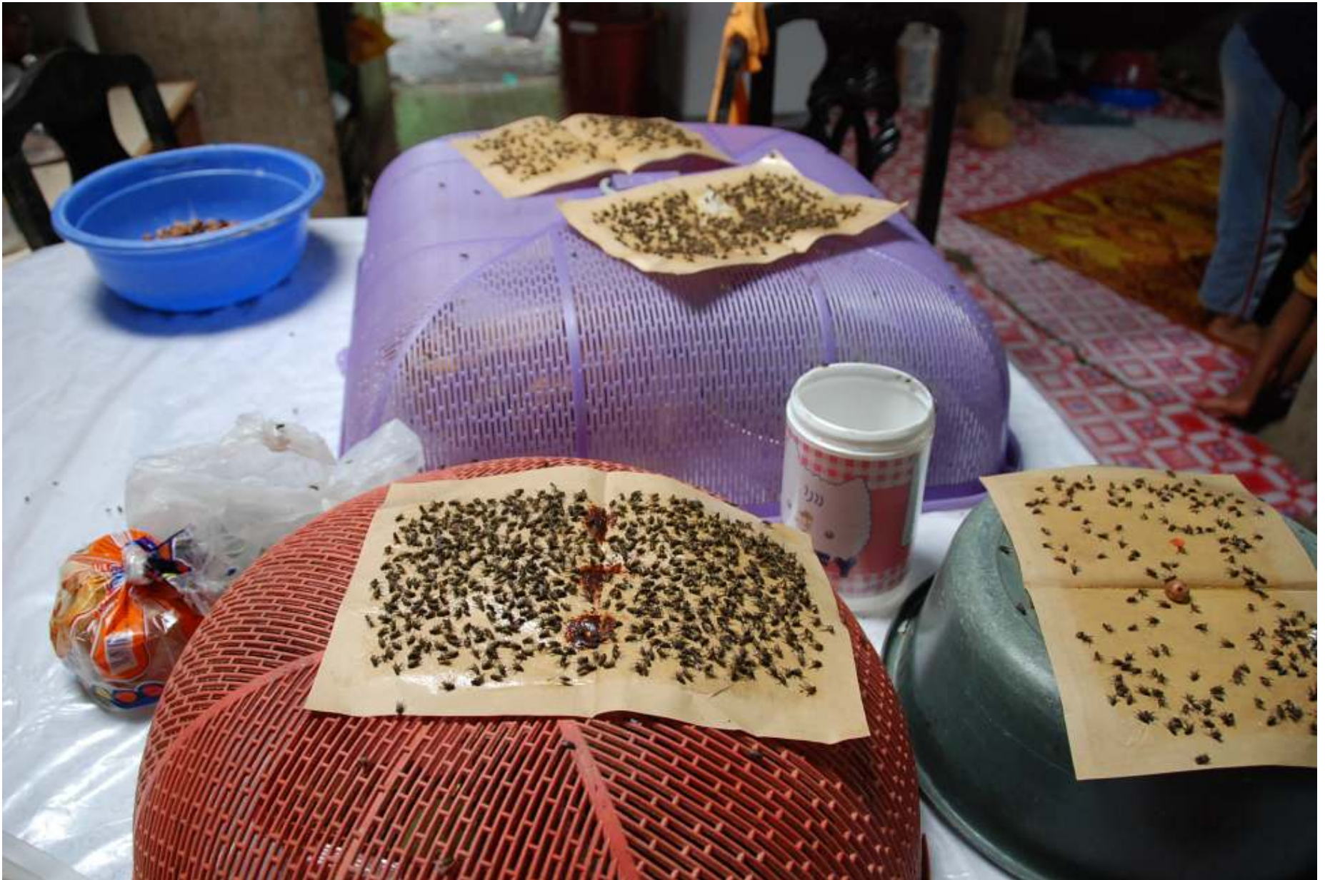
Lalat yang banyak menghurung makanan dan terpaksa menggunakan perangkap lalat.