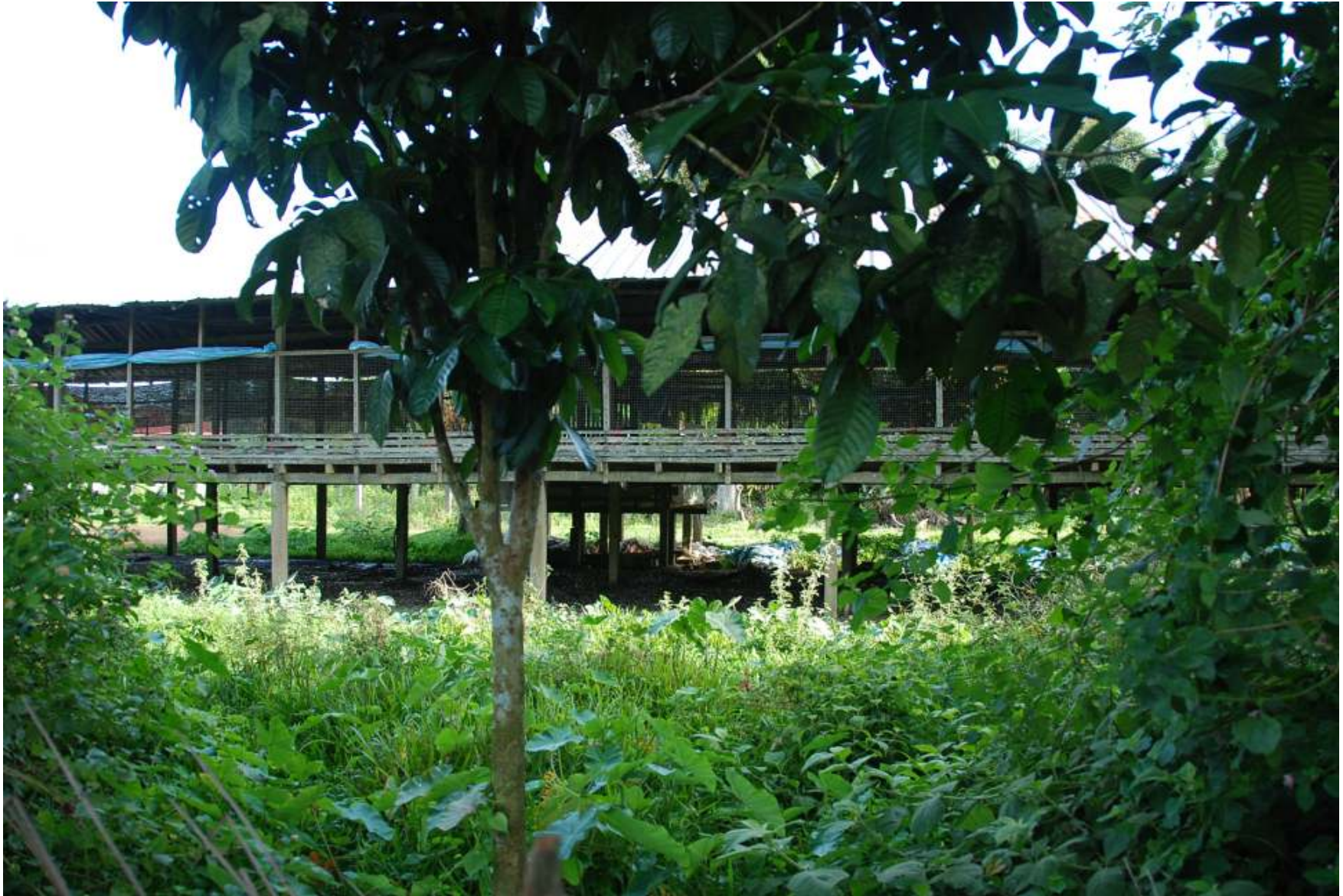
Reban ayam bersebelahan rumah saya dan orang kampung