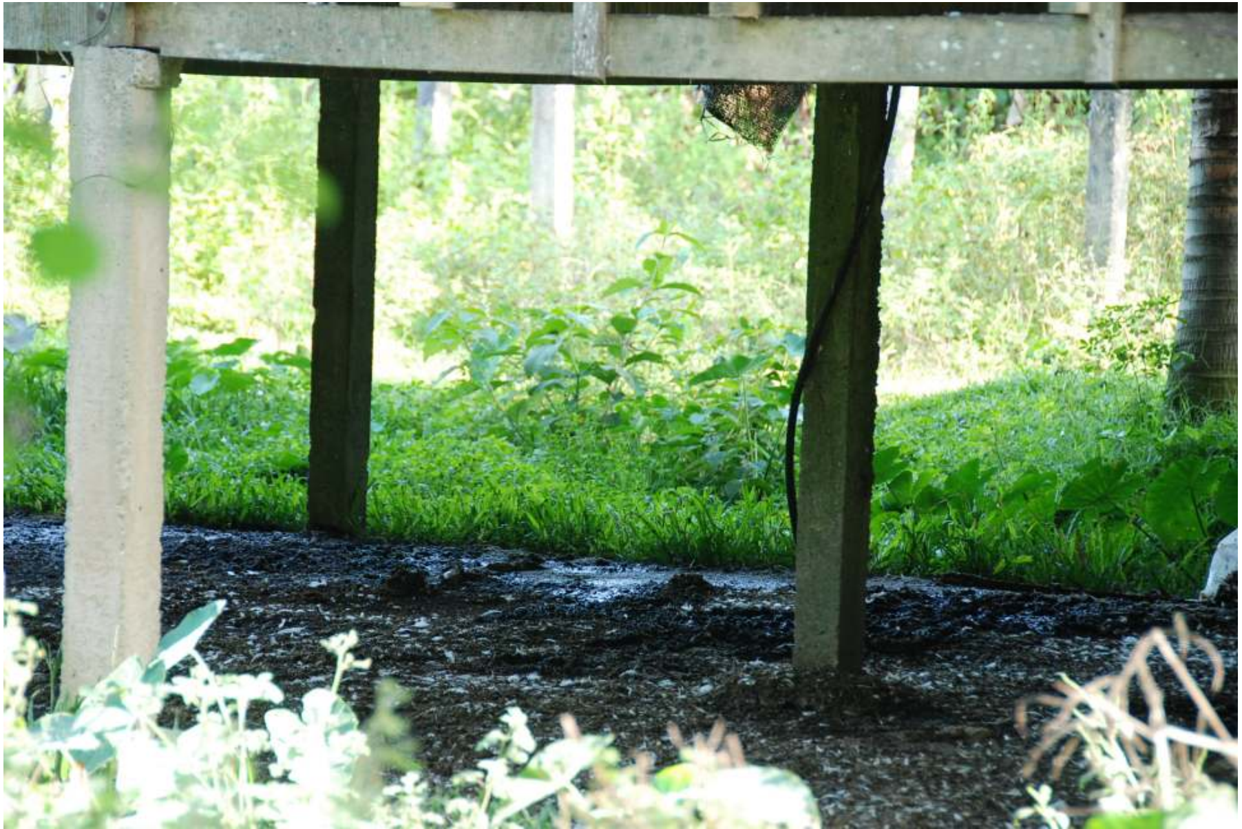
Bawah reban ayam yang berair dan dipenuhi najis menggalakkan lagi lalat membiak